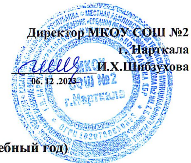
ГРАФИК родительского контроля по столовой МКОУ СОШ №2 г.Нарткала (2023 -2024 учебный год)