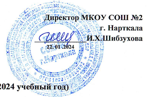
ГРАФИК родительского контроля по столовой МКОУ СОШ №2 г.Нарткала (2023 -2024 учебный год)